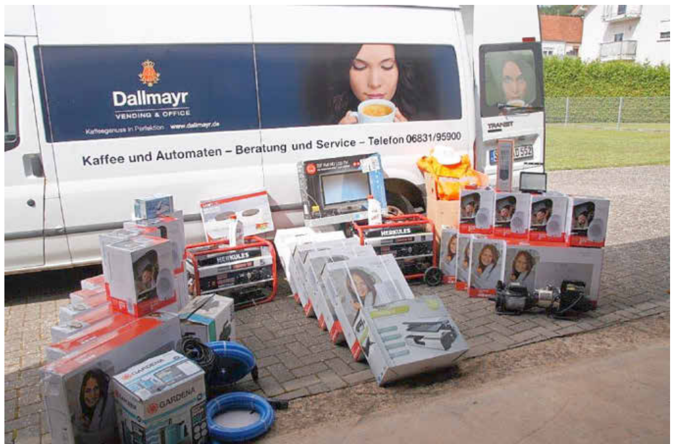
Dringend benötigte Hilfsgüter für das Katastrophengebiet

Die beiden Reimsbacher Ortsratsmitglieder geben gerne den herzlichen Dank der Betroffenen im Ahrtal für die erhaltene Hilfe weiter.