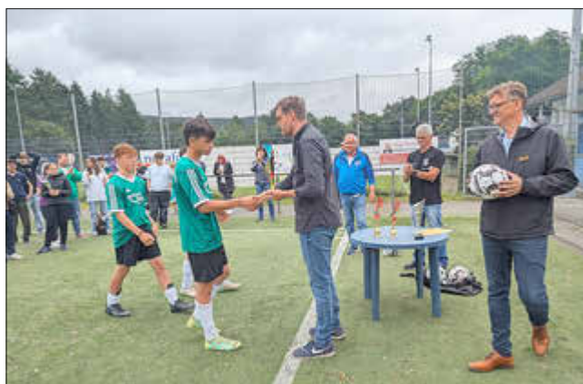
Die siegreiche Mannschaft der SG Wingertschule/Schule am Ziehwald aus Neunkirchen mit Betreuer, Organisator und Gästen