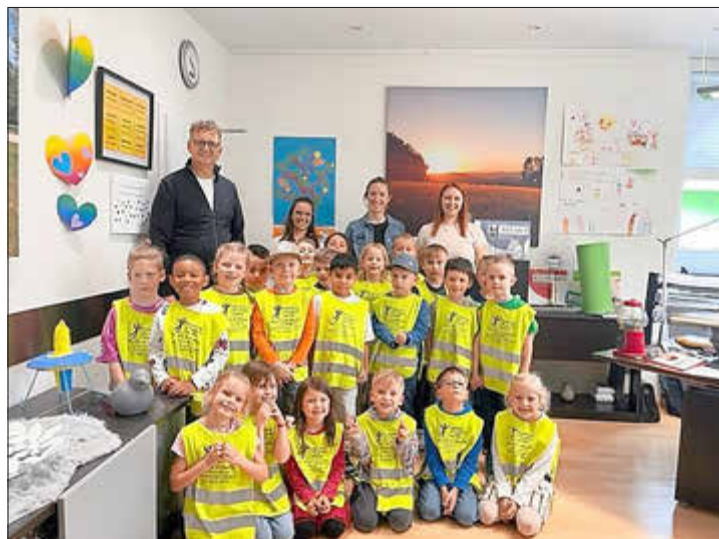
Die Vorschulkinder der KiTa St. Mauritius Haustadt bei ihrem Besuch im Arbeitszimmer des Bürgermeisters.