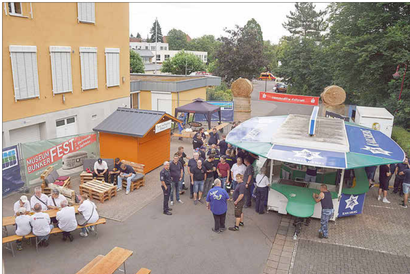
Das Hochwasser-Helferfest vor der alten Wäscherei war gut besucht.

Dank auch an das JUZ, das sich zur Durchführung der Feier am Vorabend seines Fest und zur Mithilfe bereiterklärt hat, ebenso dem Umzugskomitee für sein Engagement.“ Das Event wurde dann ausgiebig gefeiert.