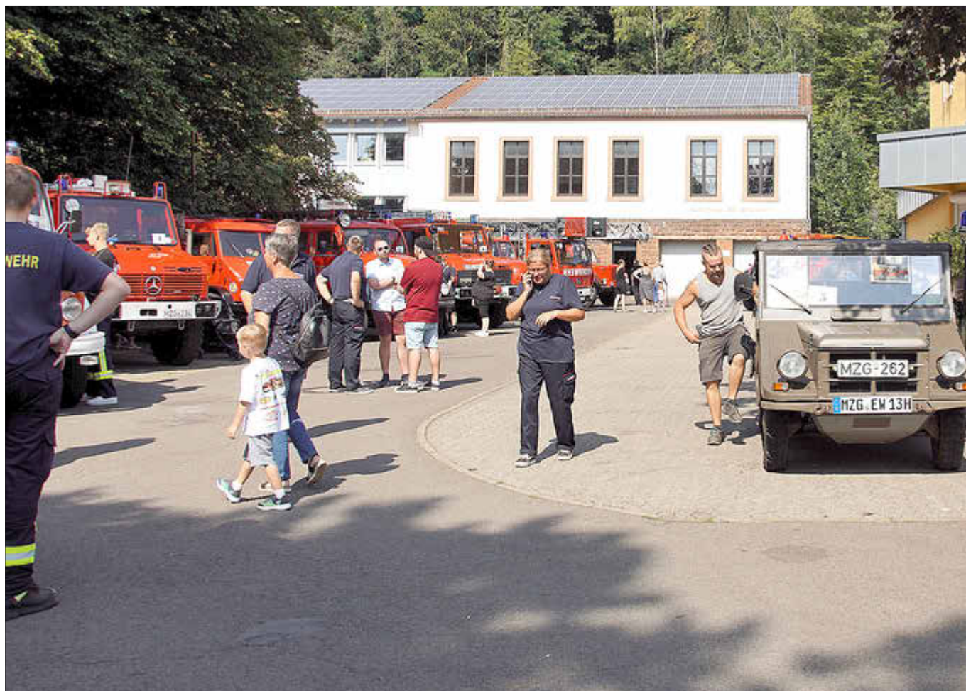
Blick auf die ausgestellten Oldtimer-Feuerwehrfahrzeuge