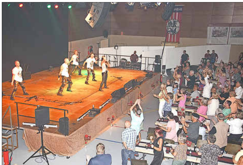
Die Magic Artists bei einem Auftritt in der ausverkauften Deutschherrenhalle

Der Gala-Abend anlässlich des 150jährigen Bestehens der Freiwilligen Feuerwehr des Löschbezirks Beckingen am Samstag mit Sport und Musik unter dem Motto „Alles echt“ war ein absolutes Highlight der drei Festtage. Den Besuchern aus nah und fern in der restlos ausverkauften Deutschherrenhalle wurde ein tolles Programm geboten, das sie mit Beifallsstürmen bedachten.