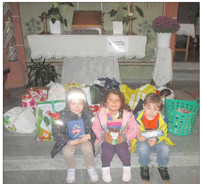
Kinder in der Pfarrkirche mit den Lebensmittelspenden