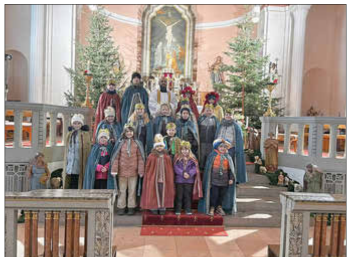
Unsere Sternsinger in Haustadt