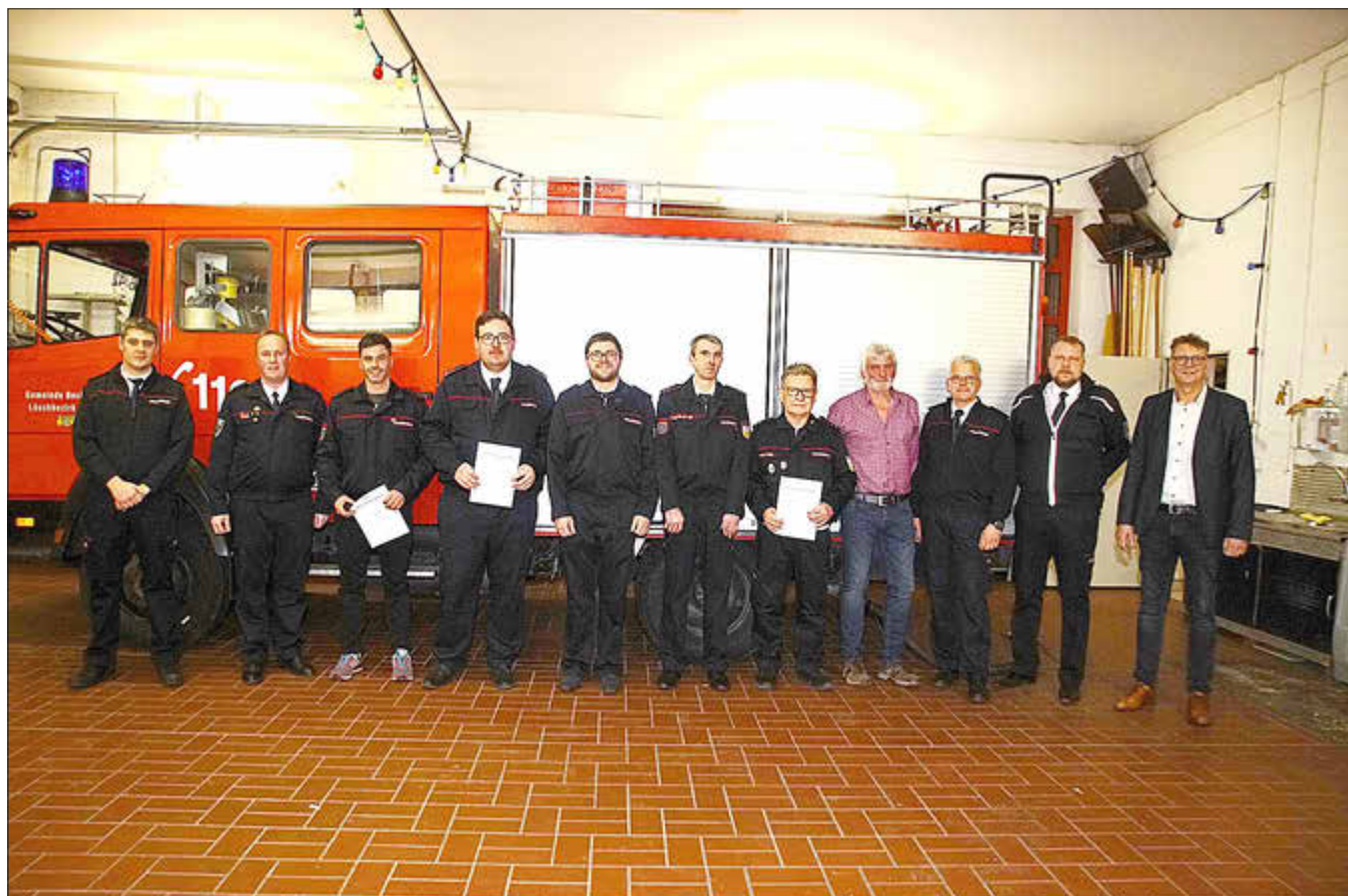
Die beförderten und geehrten Wehrmänner mit den Führungskräften und Gästen