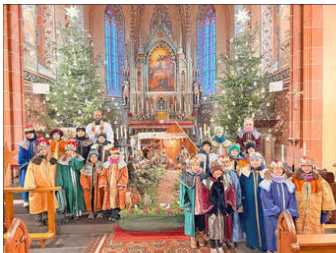
Unsere Sternsinger in Beckingen