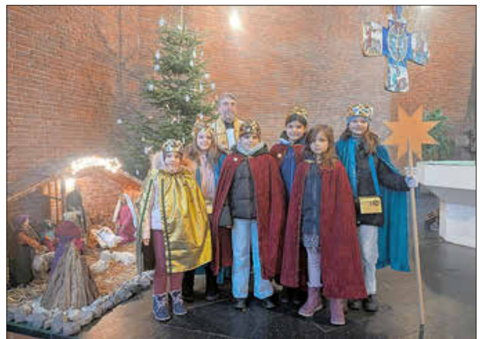
Unsere Sternsinger in Erbringen und Hargarten