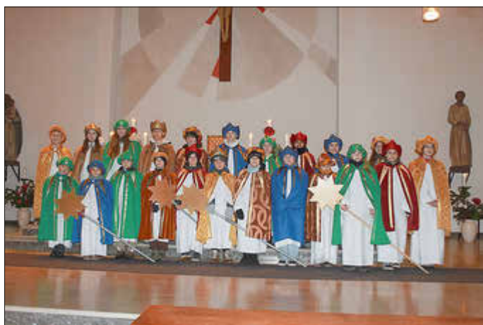
Unsere Sternsinger in Saarfels