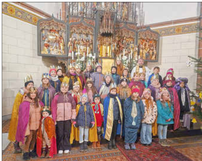
Unsere Sternsinger in Reimsbach