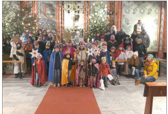
Unsere Sternsinger in Düppenweiler

Danke natürlich auch an alle, die die Kinder herzlich empfangen und Geld gespendet haben!