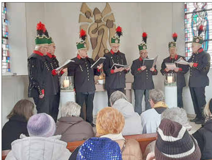
Valentinuskirmes in Düppenweiler mit Andacht und gemütlichem Beisammensein - kein Geheimtipp mehr.