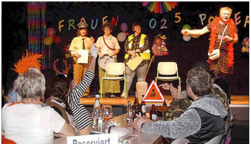
Die schwierige Fahrschulausbildung endete mit einem kommentierten Polizeieinsatz