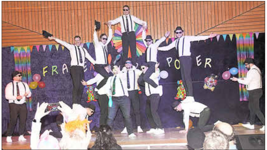
Das Männerballett „Burheck-Dancer“ überzeugte als Blues Brothers bei seinem sehenswerten Auftritt